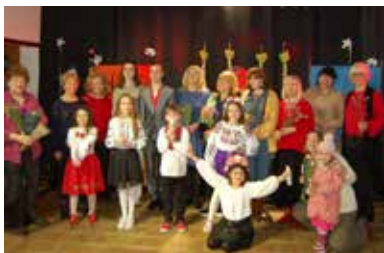
Mitglieder von Die Platte lebt e.V. und SIČ; Foto © Die Platte lebt e.V.