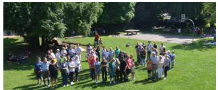
Initiative Spielplatz Kieler Straße

Auch über Lankow hinaus stellt sich eine grundsätzliche Frage: Wie wollen wir Schwerin gemeinsam gestalten? In vielen Stadtteilen – ob auf dem Dreesch, in der Weststadt oder am Ziegelsee