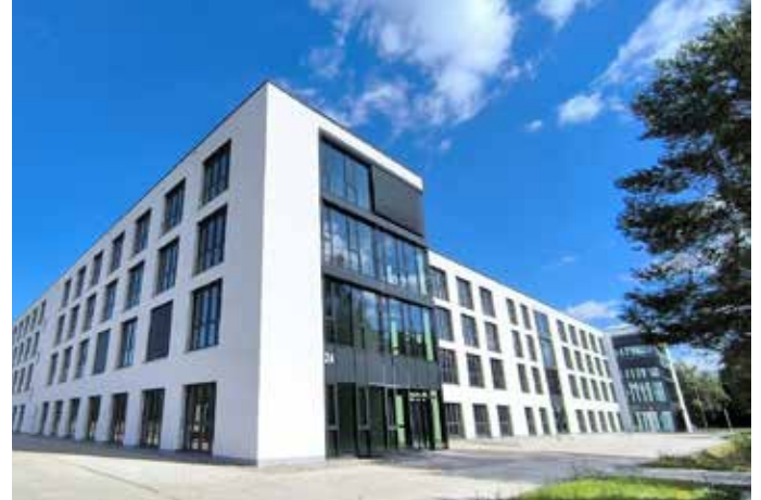
Eingangsbereich Jobcenter Mueßer Holz