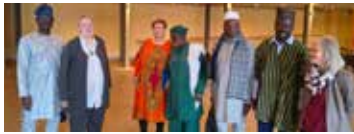
Vereinsmitglieder; Foto © couleurs afrik e. V.