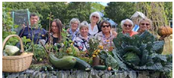
SiČ-Mitglieder im „Gemüsebeet“

Wie schön waren dieser Frühling und der Sommer im Nachbarschaftsgarten! Es gab viele Aktionen, fröhliche Begegnungen und kreative Entdeckungen. Bei der Aktion „Offene Gärten in MV“ konnten wir im Juni und September zahlreiche Gäste begrüßen, die sich über unsere grüne Oase im Mueßer Holz freuten. Auch der Umweltbildungs- und Gesundheitstag war wieder ein voller Erfolg: Über 80 Kinder nahmen begeistert teil, bastelten kleine Biotope, probierten Kräuterquark, machten Yoga oder versuchten sich im Kienapfel-Weitwurf. Im Juni war der Garten Schauplatz eines besonderen Ereignisses: beim Kinderfest der Igel-Kita rollten rund 80 Motorräder an. Mutige Kinder durften eine Runde mitfahren, bevor gemeinsam gefeiert wurde. Im Sommer fand außerdem das internationale Kochprojekt „Essen verbindet“ statt. Drei Mal wurde im Garten gemeinsam gekocht – ukrainisch, syrisch, schweizerisch und deutsch – und anschließend in geselliger Runde gegessen und erzählt. Beim Ernte-Dankfest im September wurde die bunte Saison mit Spiel, Spaß und gutem Essen gemeinsam verabschiedet. Das ganze Jahr über begleitete eine Filmcrew um Regisseur Dieter Schumann das Leben im Garten. Aus den Aufnahmen ist nun ein Kinodokumentarfilm entstanden „Elysium – Garten der Hoffnung“, der beim Filmkunstfest 2026 Premiere