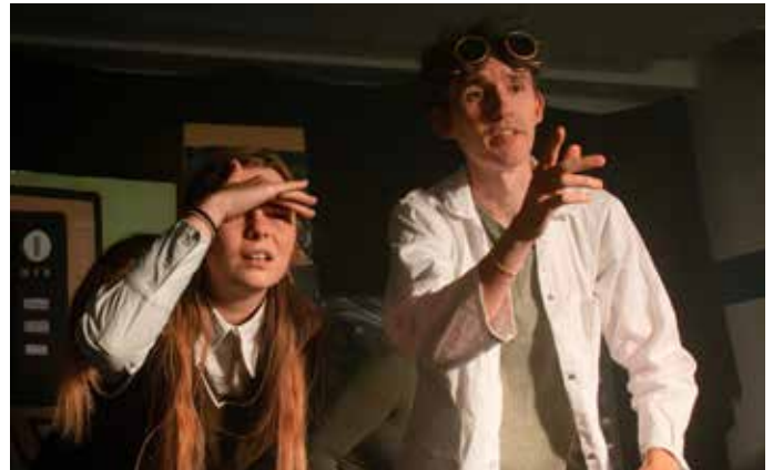
Ausschnitt aus der Sneak im vergangenen Oktober, Foto © Malina Vo_tografie

Der Schweriner Musical Club besteht aktuell aus neun Laien Darstellern, welche unter theaterpädagogischer Leitung bei der Stückentwicklung begleitet werden. Das Stück entstand durch die aktuellen Themen der Gruppe, sowie durch Improvisationen bei den wöchentlichen Proben. „Am Ende ging alles ganz schnell und mir war klar: das wird ein Musical, welches nicht aktueller in unsere Zeit passen kann.“, erzählt Marc Waack begeistert. Gepröbt wird immer dienstags in der Alten Post am Berliner Platz von 18.00 – 20.00 Uhr. Und es gibt bereits einen Ausblick für das