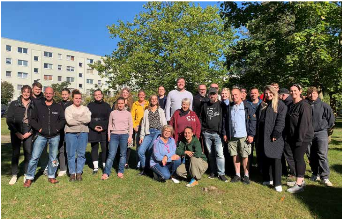
Teamfoto TV III zur gemeinsamen Herbstsitzung im Oktober 2025