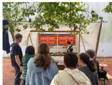
1. Die Kinder konnten ihren Mut beim Klettern beweisen, 2. Fleißige Hände bearbeiten den Speckstein 3. Kinder spielen Vier gewinnt im Großformat 4. Kinderschminken darf auf dem Schulfest nicht fehlen 5. Trotz des Regens ein gelungenes Fest 6. Wer trifft die meisten Dosen; © Fotos: Ulrike Kunze / Carola Ziemann