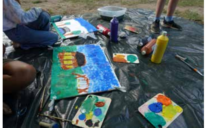
Kinder malen ihren Stadtteil, Foto © Susanne Utech

Die gemalten Kunstwerke der Kinder wurden vom 26.09. bis zum 05.11.25 im 1. Obergeschoss der Marienplatz-Galerie ausgestellt. Das Projekt wurde von der Partnerschaft für Demokratie Schwerin im Rahmen des Bundesprogramms Demokratie leben! gefördert. Durchgeführt wurde das Projekt von der Künstlerin Susanne Utech aus dem Verein „Was jetzt?! e.V.“ Der Verein stellt Räume bereit, um eigene Fragen zu stellen, sich zu vernetzen und Wege der gesellschaftlichen Beteiligung aufzuzeigen. Es gibt kostenfreie Veranstaltungen sowie Lesungen und kreative Workshops. Dem Verein liegt am Herzen, Menschen durch kreative Projekte