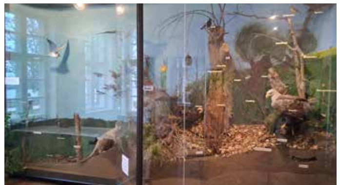
Diorama im Ausstellungsraum mit zahlreichen Präparaten; Foto © Bund M-V