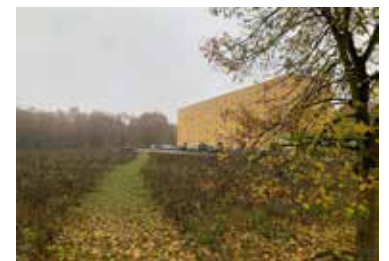
Freifläche Otto-von-Guericke Straße mit künftiger Wegführung

Neuigkeiten, die die Fläche betreffen, werden zukünftig auch in dem neuen Informationskasten, der an der Bushaltstelle Otto-von-Guericke-Straße aufgestellt wird, veröffentlicht.