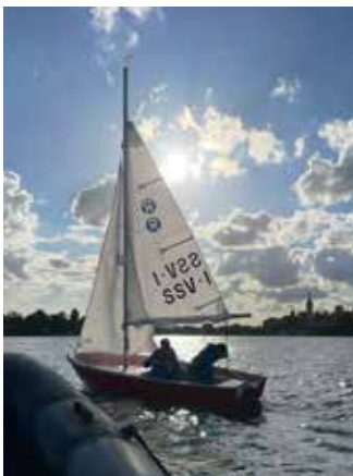
Ganztagig Lernen mit dem Schweriner Segelverein von 1984 e.V.