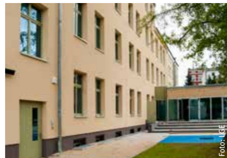
Saniertes Hortgebäude „Schwerin-Mitte“

Investitionskosten: 5,2 Mio. Euro Städtebaufördermittel: 1,6 Mio. Euro