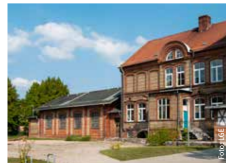
In Planung: Modernisierung für KiTa „Fritz“

Geschätzte Investitionskosten: 3,0 Mio. Euro