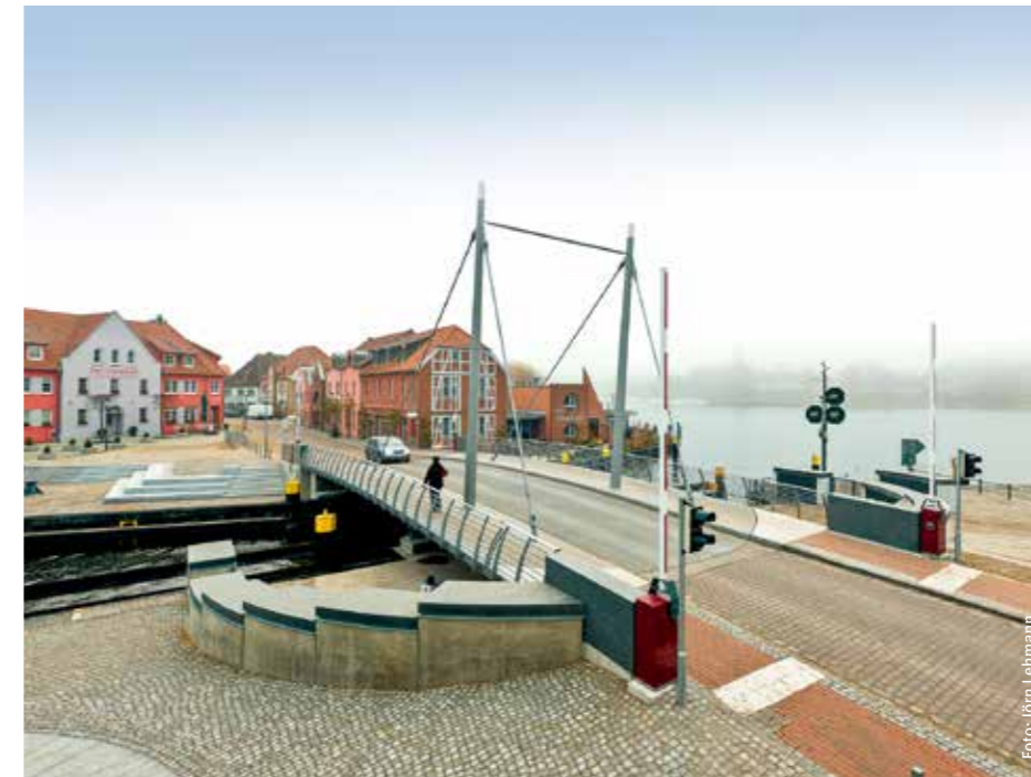
Verkehrsemissionen an der Drehbrücke sollen gesenkt werden.

Die Inselstadt ist auf dem Weg zu einer klimafreundlichen Kommune