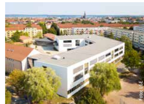
Neubau des Schulkomplexes Goethe-Gymnasium

Neue KiTa: Neu und in Planung ist die Idee, auf dem Grundstücksareal des ehemaligen Fridericianums am Pfaffenteich eine Kindertagesstätte mit ca. 72 Plätzen zu schaffen. Dafür könnten das Schulnebengebäude und die unter Denkmalschutz stehende Turnhalle modernisiert und umgebaut werden.