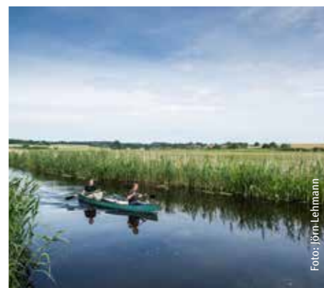
Paddler auf der Warnow

Daraus konnten in den vergangenen Jahren konkrete Maßnahmen umgesetzt werden, mit dem Ziel, die Netzwerke der Wasserwanderanbieter in ihrer Arbeit zu unterstützen und die touristische Infrastruktur zu verbessern. Der Schutz von ökologisch sensiblen Naturräumen wie z.B. dem FFH-Gebiet Warnowtal ist dabei ein wichtiger Aspekt. Das Leitprojekt wird als Kooperationsprojekt mit Partnerinnen und Partnern innerhalb und außerhalb der LEADER-Region – dem Altkreis Parchim – umgesetzt.