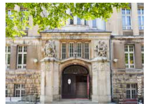
Noch unsanierte Fassade der Erich-Weinert-Schule

Investitionskosten: 6,4 Mio. Euro Städtebaufördermittel: 4,1 Mio. Euro